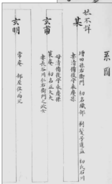
蜂須賀家家臣成立書並系圖（データベース近日公開予定）