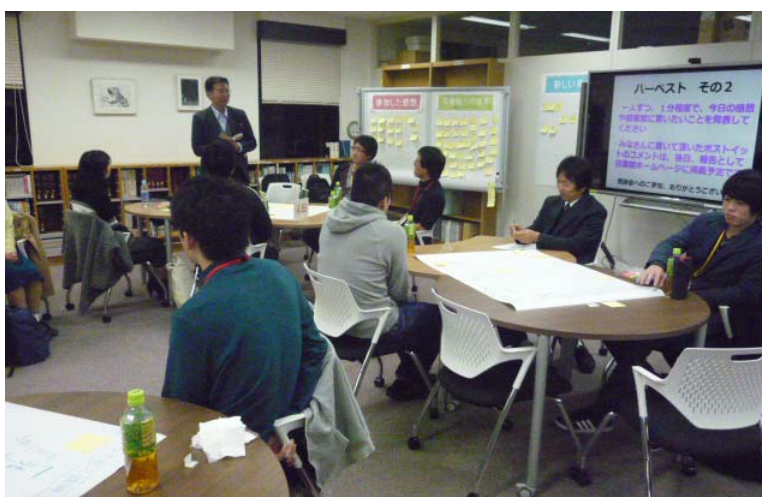
要望や提案を行う様子